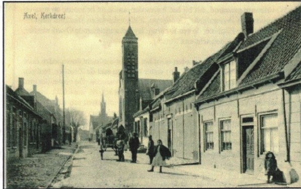
De Kerkdreef te Axel heel lang geleden

"Ga je over Axel schrijven?" Ze staat vlak voor me aan tafel. Haar hand steunt op de leuning van een stoel; haar blik is naar buiten gericht, de tuin in.